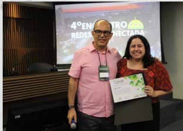
Entrega de Comenda