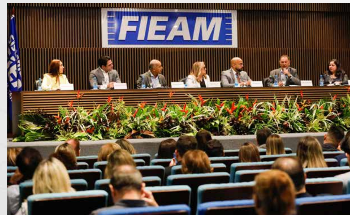
Cerimônia de abertura

O presencial proporciona oportunidades de aprofundar temas, expor desafios, e gerar brainstorms espontâneos a partir do compartilhamento de vivências